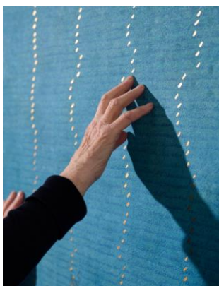
Greta Schödl, Ohne Titel, 2024 © Greta Schödl, Foto: Giovanni Bortolani

In Werken wie „Preußischblau auf Leinwand“ (1977) überzieht sie die Bildfläche Zeile für Zeile handschriftlich mit dem Titel selbst. Die Schrift verdichtet sich zu einem Gefüge aus Linien, das weniger gelesen als vielmehr gesehen wird. Bedeutung wird nicht aufgehoben, sondern transformiert: Schrift wird zur Spur, zum Rhythmus, zur visuellen Erfahrung.