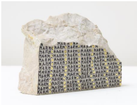
Greta Schödl, Marmo di Trani, 2024 © Greta Schödl. Courtesy Richard Saltoun Gallery, London, Rome and New York, Foto: Giorgio Benni

Seit 2000 bearbeitet Schödl auch Marmor- oder Granitsteine. Einen Marmorblock überzieht sie vollständig mit dem italienischen Wort Marmo (Marmor). Die Glätte des geschnittenen Steins dient ihr als Schreibfläche und steht im Kontrast zu dessen materieller Schwere. Kleine Blattgold-Akzente sind rhythmisierend in das „O“ des Wortes Marmo eingesetzt und betonen zusätzlich den Rapport des Musters. 2024 ist Greta Schödl unter anderem mit den in Krems gezeigten Marmorsteinen bei der Biennale von Venedig vertreten.